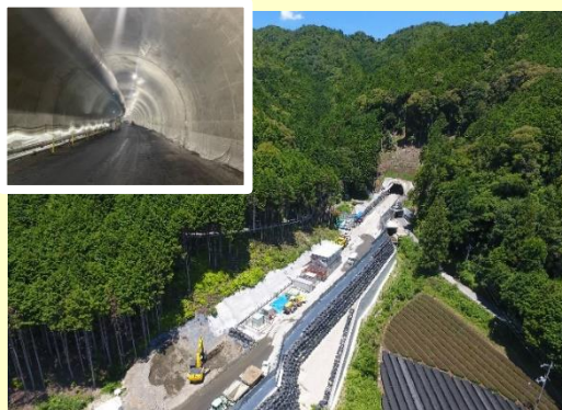
宇治木屋線 (宇治田原町～和束町)