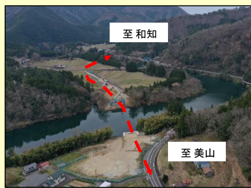
綾部宮島線 脇谷バイパス(南丹市)