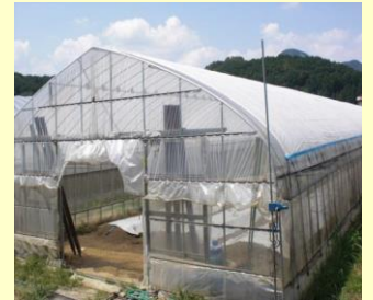
遮熱資材で覆ったハウス

生産コストの削減や高付加価値化につながる取組を支援 (事業例)ハウスの多重被覆やPR用ラベルの作成 等