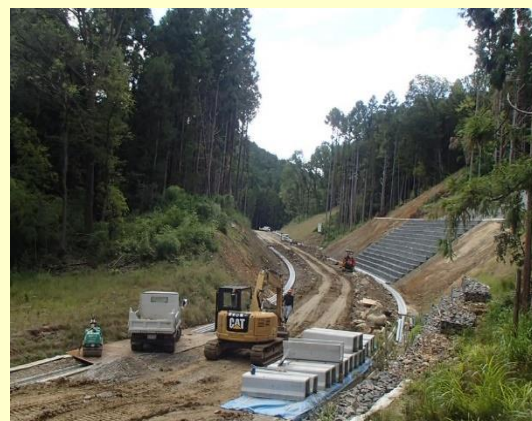
国道423号 法貴バイパス(亀岡市)