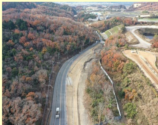
国道307号 (市辺～奈島(城陽市))